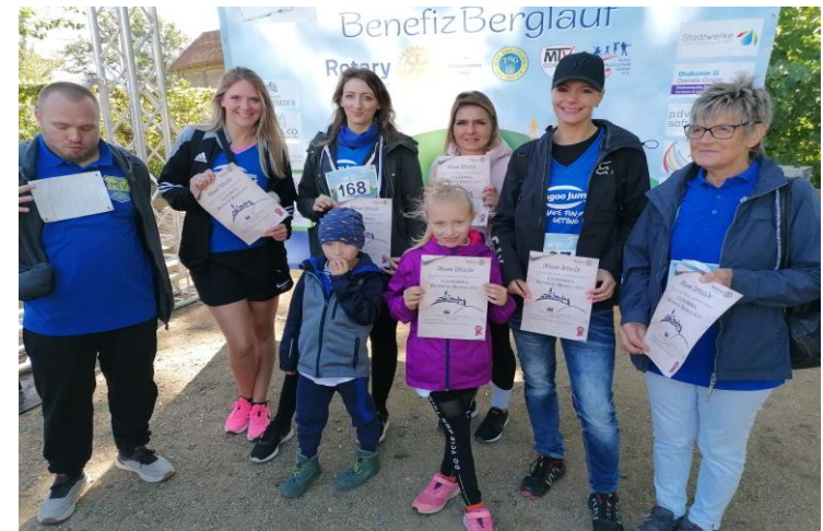
Die MTV-Mannschaft von 5 – 71 Jahre