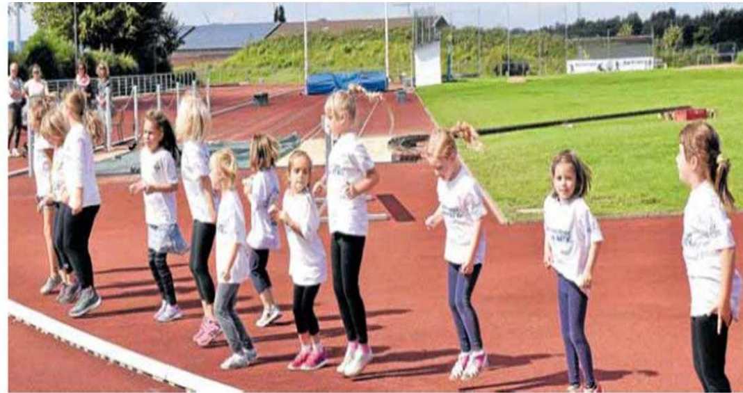
Die „Little Lollipops“ hatten viel Spaß bei ihrer Vorführung

In den Kursen von Trainerin Bock sind unter anderem Teilnehmer aus Vienenburg, Salzgitter und Goslar dabei. Die nächsten Kurse starten im Oktober. Auch die Gäste des Sommerfestes durften unter Anlei-